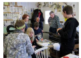
Näppiläisiä pläkkyrin pajalla