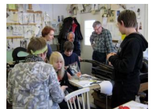
Näppiläisiä pläkkiopin pajalla