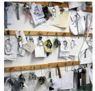
Piparimuottien malleja pläkkiopin seinällä